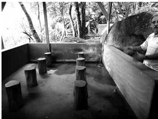
写真4. カーピの蔓を粉碎する場所

アマゾンのシャーマンが伝統的に用いてきたアヤワスカ (ayahuasca) とは、現地のケチュア語で「死者の蔓」「魂の蔓」を意味する。地域によってはヤヘ (yagé) とも呼ばれる。アヤワスカの学名はバニステリオプシス・カーピ (banisteriopsis caapi) であり、100メートル以上にまで達することのある巨大な蔓植物である。その硬い樹皮を木槌で打ち砕き、もう一種または数種の植物の葉を混ぜてサンドイッチ状に積み上げ、釜で長時間煮詰めることによって、儀式で用いられる「神様のお茶」が生成される (吉野, 2011)。写真4、5はリオデジャネイロ郊外の、アヤワスカを生成する場所である。