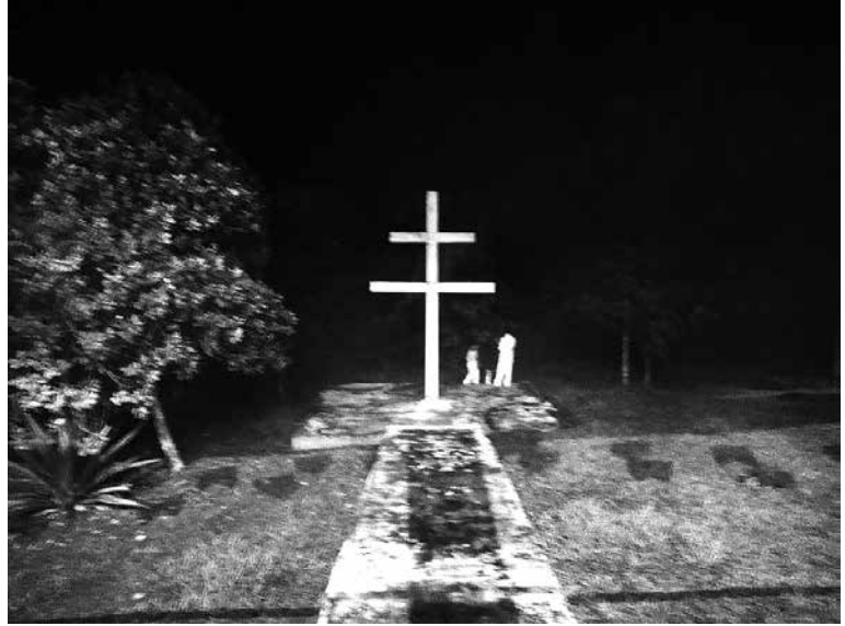
写真3. サント・ダイミのダブル・クロス

② 祈り 。はじめにキリストへの祈り、聖母マリアへの祈り、そしてアマゾンの女神ジュラミダンへの祈りが行われる。儀式は祈りに始まり、祈りをもって終わる、厳粛な雰囲気である。排他的な一神教でありながら、アマゾニア土着の女神ジュラミンダンと混交しているのは興味深い。サント・ダイミのシンボルは通常の十字架に、横に一本加わったダブル・クロスである（写真3）。キリスト教の装いでありながら、アマ