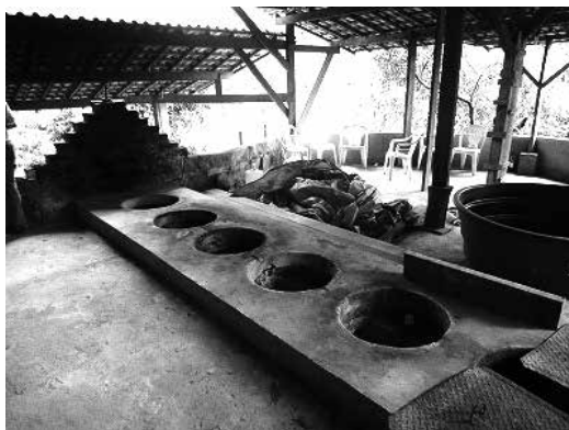
写真5. アヤワスカを煮込む場所

もう一種の植物としては、サイコトリア・ヴィリデイス (psychotria viridis、チャクルーナとも呼ばれる) の葉を混ぜる場合が多い (Grob, C.S. 1999)。一般には、混合して煮込まれた飲料をアヤワスカ (ayahuasca) と呼んでいる。