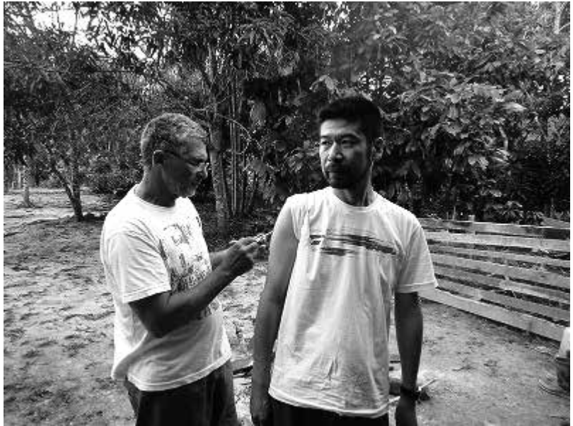
写真7. 特殊な蛙の粘液を火で焼いた肌にすり込むと免疫力が向上するという

現在我が国では、医学をはじめとする多くの学術的文献において、サイケデリクスは「幻覚剤」と訳されているが、語源的な意味とはむしろ正反対で、否定的な価値判断が含まれた訳語である。精神展開剤という訳の方が中立的であるが、あまり一般的ではないため、本稿ではサ